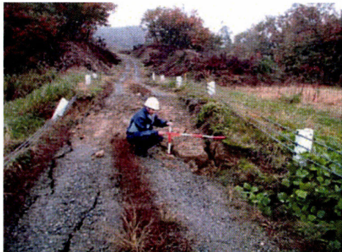
天端の沈下と変形