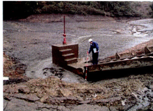
斜樋部の被害状況