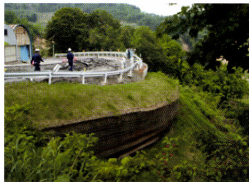
ジオテキスタイル補強土壁の被災状況