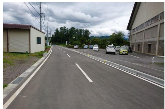
A S 舗装施工後