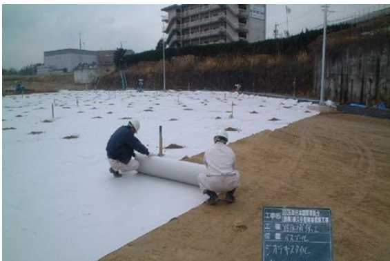
ジオテキスタイルの敷設施工状況