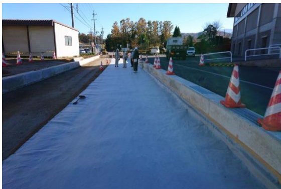
ジオテキスタイルの敷設