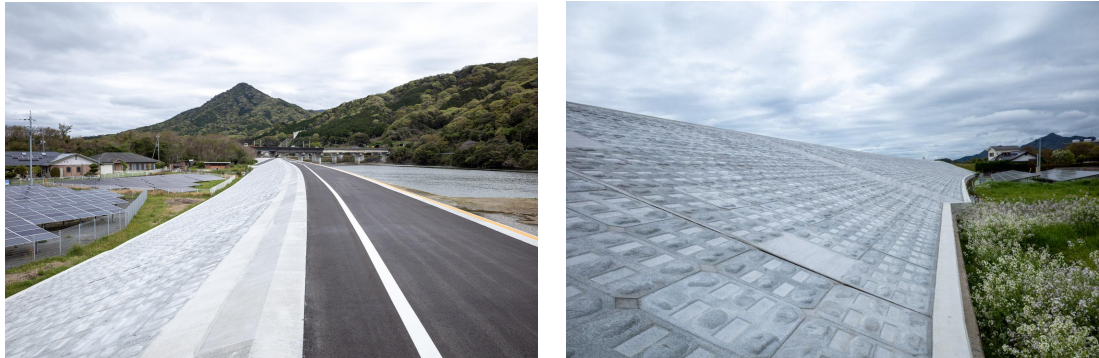
粘り強い堤防（佐波川）