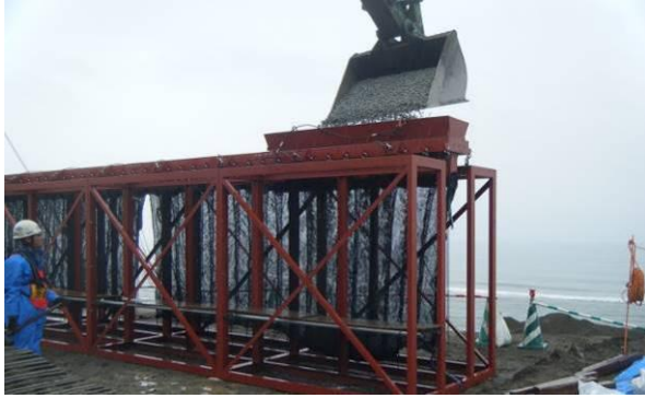
セル型グラベルマットの中詰め作業