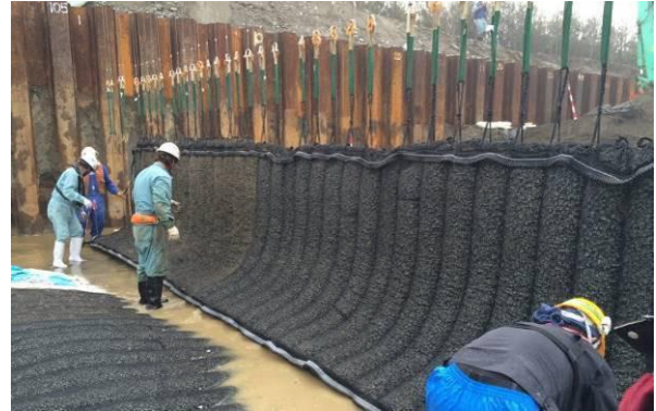
セル型グラベルマットの敷設作業