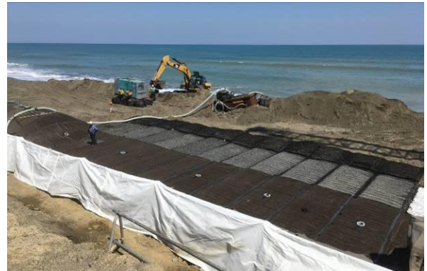
サンドパックの上載