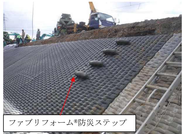
ファブリフォーム®防災ステップ施工事例