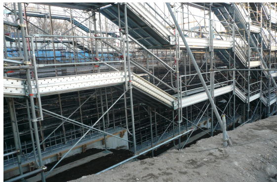
写真-4 施工状況（仮設足場）