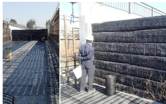
写真-6 工区境での補強盛土の端末壁面