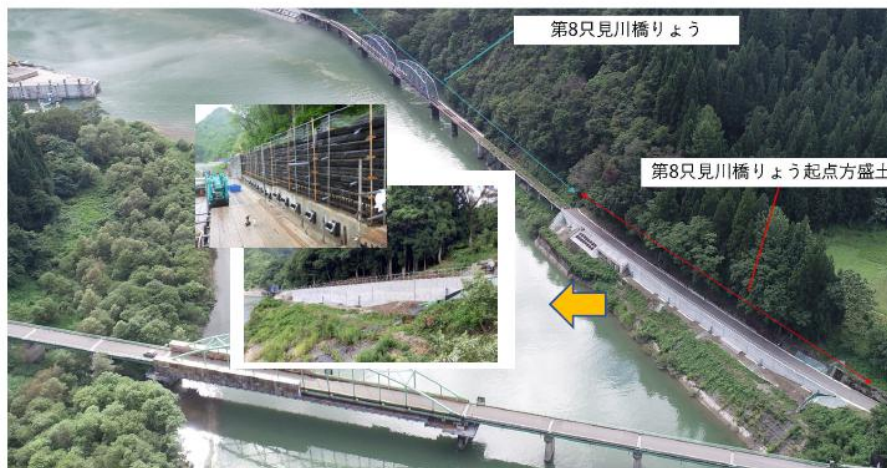
図-12 復旧工事の施工状況及び完成状況