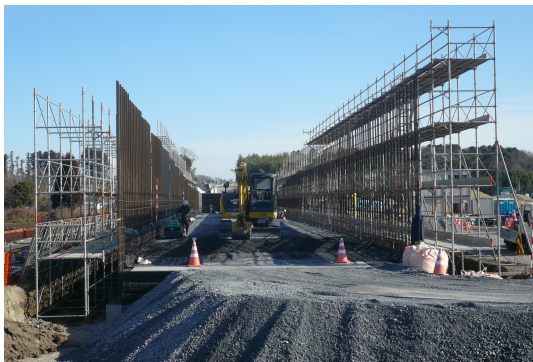
図-3 全 景