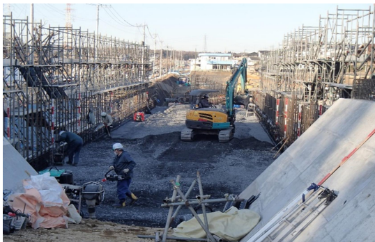
写真-5 施工状況（締固め作業）